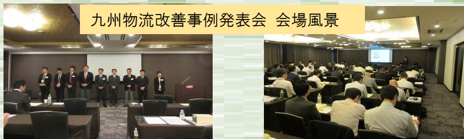
九州物流改善事例発表会 会場風景